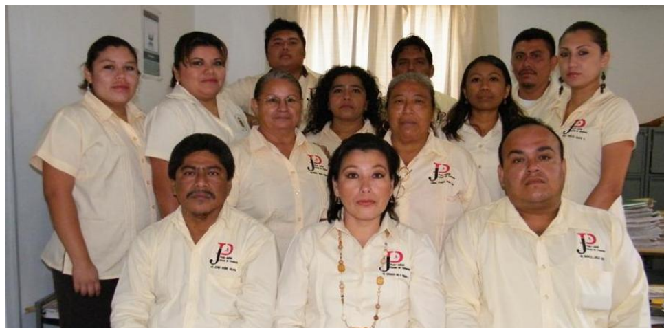
Imagen pública del Tribunal Superior de Justicia del Estado

Este curso consta de 3 capítulos que permitirán al usuario reflexionar y aprender más sobre: la estructura del Código de Ética del Poder Judicial del Estado de Campeche , las disposiciones generales que señalan a los destinatarios, y el objeto que persigue el mismo, así como los deberes morales que ha de observar el servidor judicial en el ejercicio de su función.